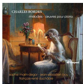
Les Mélodies de Charles Bordes VOL. I