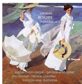
Les Mélodies de Charles Bordes VOL. II