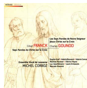
Franck – Gounod Les sept paroles du Christ