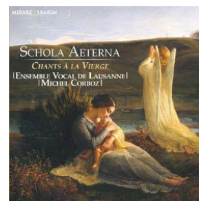
Schola Aeterna Chants à la Vierge